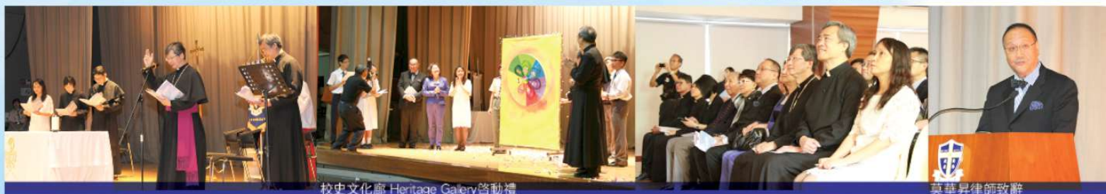
校史文化廊 Heritage Gallery 啓動禮