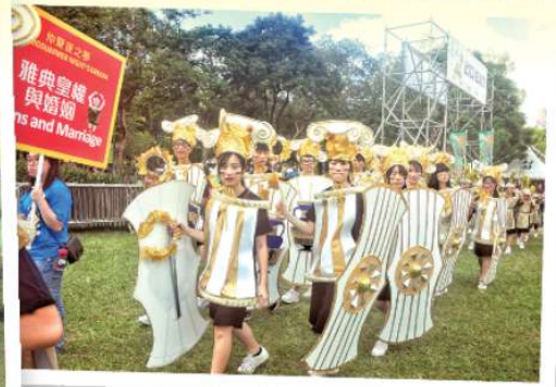
同學穿上巡遊展品，並在銅鑼灣維多利亞公園參與巡遊活動