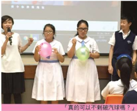
「真的可以不刺破汽球嗎？」