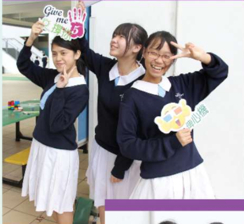
即影即有相活動大受歡迎，友情洋溢。