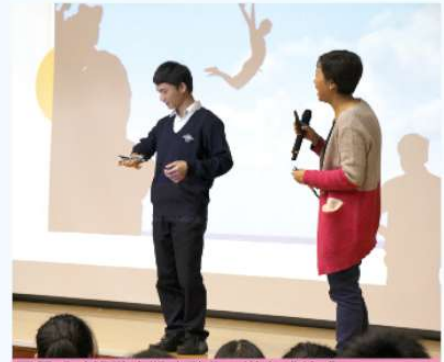
同學成功挑戰高難度動作，滿有成就感。