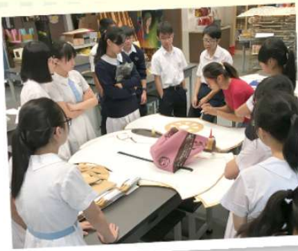
中四級視藝同學在視藝室專注製作巡遊展品