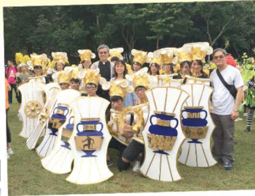
與校牧和校長合照