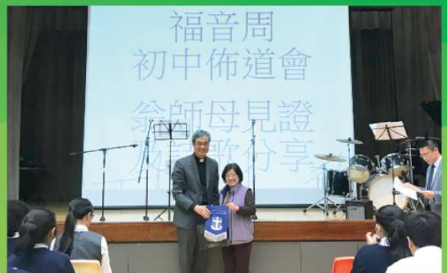
許翁敬端師母信仰經歷分享