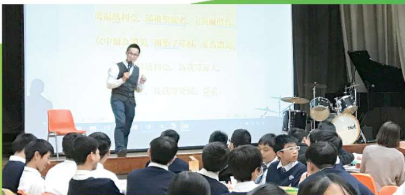
江志成老師信仰經歷分享