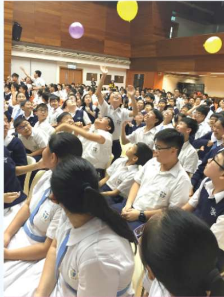
同學投入參與拋汽球活動。