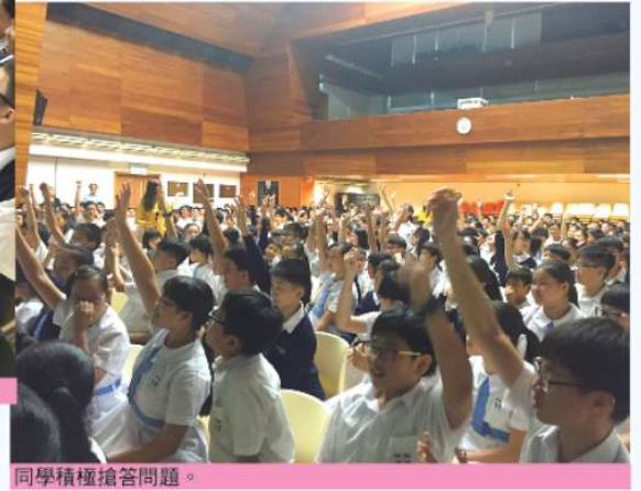
同學積極搶答問題。