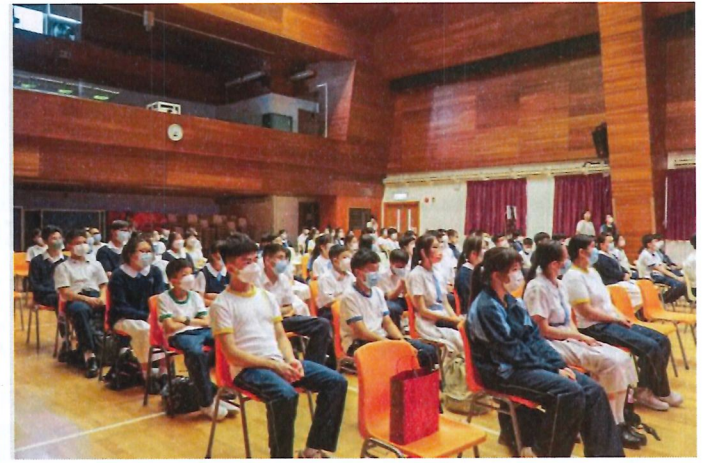
同學聚精會神觀看並聆聽南沙黃閣中學師生的種種分享