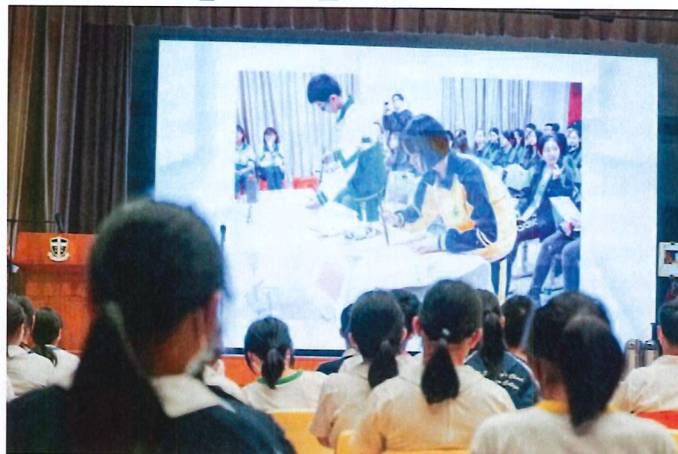
簡單重溫兩地學校於 2015-2021 年度六年間所舉行的各項姊妹學校交流活動剪影