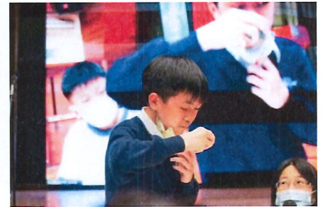
同學參與活動， 細味中國茶道精韻