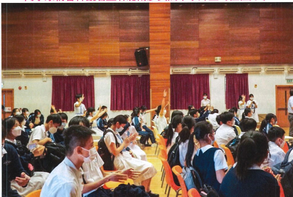
本校同學向黃閣中學同學問好