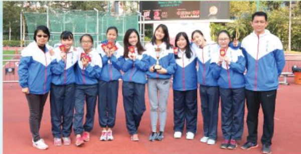
女子田徑隊獲「中學校際田徑比賽第二組女子甲組團體賽亞軍」