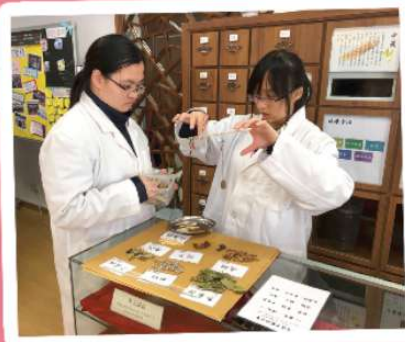
同學穿上「中醫袍」，認識不同的藥材，嘗試「執藥」，未知同學將來會否以此為職業呢？

中五級： Conducting a survey on tourists' shopping experience