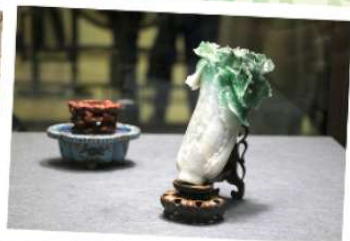
欣賞國立故宮博物院珍藏 — 「豬肉石」、「翠玉白菜」(左起)