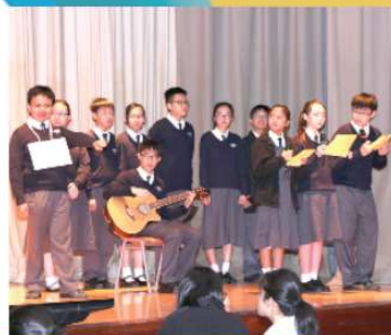
Junior form drama The Pied Piper

The highlight of the English Week was definitely the Language Arts Festival. It was held on Friday afternoon, the last day of the week. The drama performance by S1 and S2 was hilarious. However, the atmosphere of the show reached boiling point during the 'Singing Contest' as in the past.