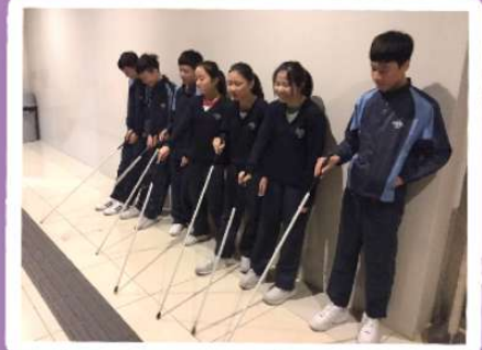
在漆黑環境中，同學需要摸黑活動，究竟是甚麼感覺呢？同學在活動前，需要學習視障人士使用手杖的技巧。看來，他們都頗具熟練！