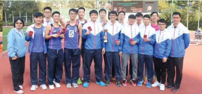
男子田徑隊獲「中學校際田徑比賽第三組男子甲組團體賽亞軍」

本組亦積極鼓勵隊員「走」出去，參加坊間的訓練及比賽，藉此增加比賽經驗，提升實戰能力同時學習最新訓練資訊，開闊視野，增長見識。