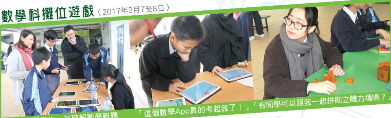
老師與學生一起破解數學難題