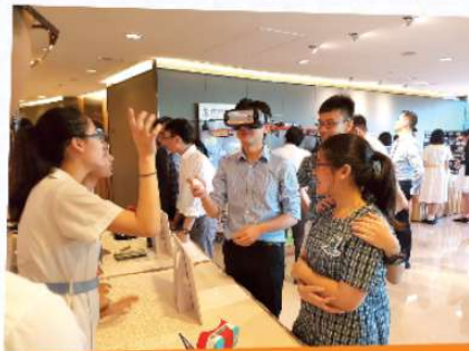
參賽學生向其他學生師生展示製成品