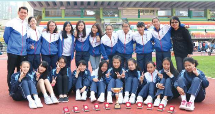
學界女子田徑隊大合照

今年體育組積極備戰學界比賽，除常規訓練之外，還通過加時訓練及體育訓練營，力爭隊員在比賽前保持最佳作戰狀態。於二月舉行的學界中學校際田徑比賽中，本校田徑隊上下齊心、努力拼搏，分別取得男、女子甲組團體亞軍的優異成績。