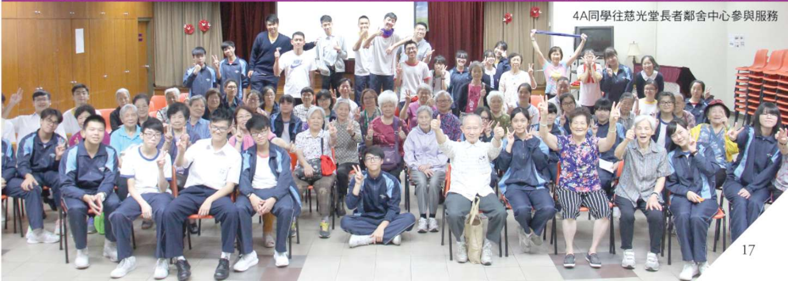
4A同學往慈光堂長者鄰舍中心參與服務