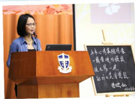
鍾教授向各位老師、同學分享情感與散文的關係。