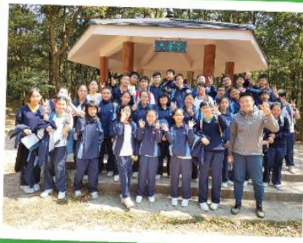
烈日當空下，同學和老師在荃灣牛寮參與野外定向，過程雖然辛苦，但完成後卻難掩歡愉之情。