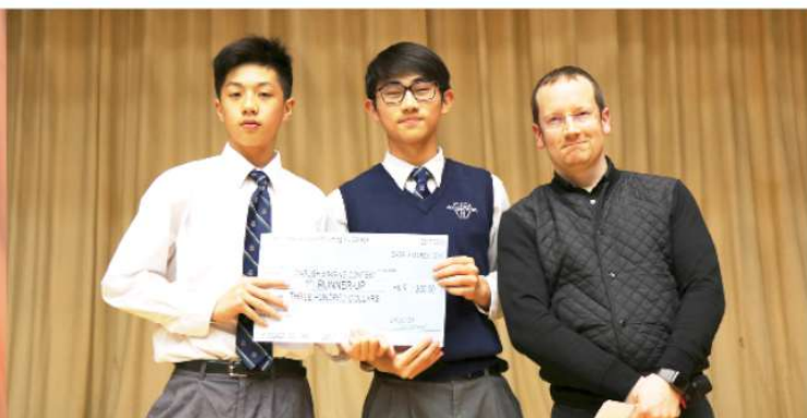
First Runner-Up of Singing Contest (Solo)