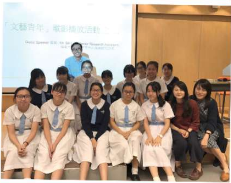
電影評賞後，同學和導師來張大合照。