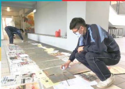
Making props is hard work