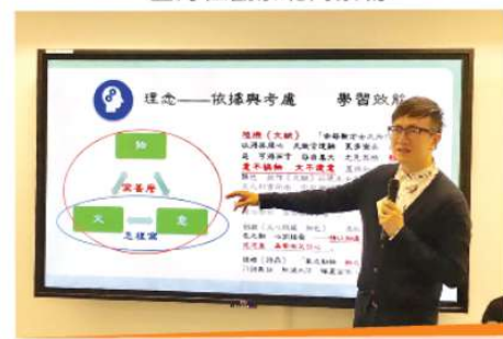
陳副校長分享教學心得