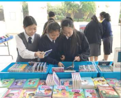
English Book Fair

This year the English Week was held from 28th February to 3rd March 2017. Teachers of the English Department organized a series of activities, namely English Singing Contest, Book Fair, Song Dedication, Pictionary Competition, OLE Outing and Language Arts Festival during the week. Students' overwhelming participation made the week a successful one indeed! In this activity-filled week, students further realized that learning English is fun. They were exposed to English everywhere and experienced various interesting and lively ways to learn it.