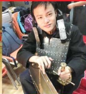
I just want to be a soldier...