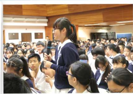
難得可以向著名作家直接提問，我校同學都把握機會，爭相提出閱讀鍾教授著作時的疑問，以及寫作方面的問題。