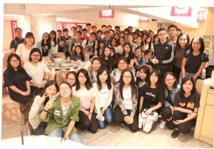
行程第二晚與友校旅港開平商會中學的師生共進晚餐及交流