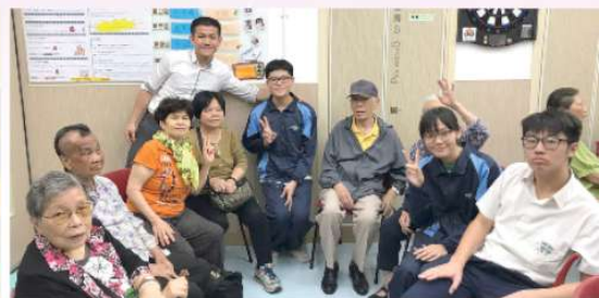
4R同學往中西區長者地區中心服務