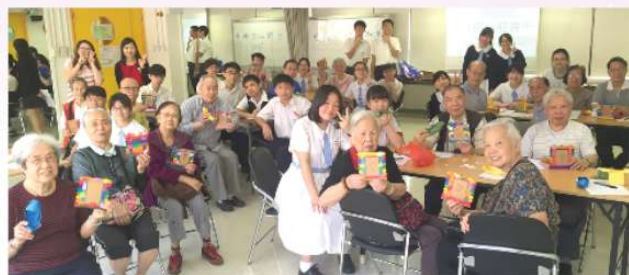
4M同學到灣仔長者地區中心進行迎靖端午活動