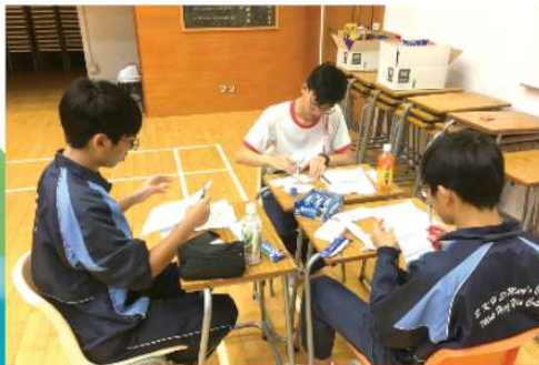
MCs making prompt cards for presentations