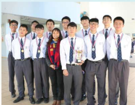
男子籃球隊獲「香港聖公會基督顯現堂第二屆籃球比賽」男子組冠軍

本組亦積極鼓勵隊員「走」出去，參加坊間的訓練及比賽，藉此增加比賽經驗，提升實戰能力同時學習最新訓練資訊，開闊視野，增長見識。