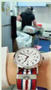
4M 趙婉兒作品 《家是平凡的》