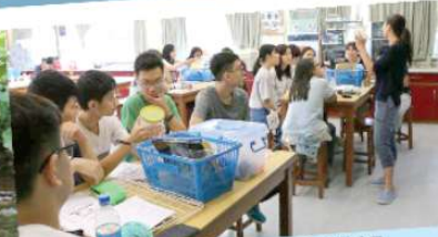
同學細心聆聽導師講解