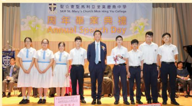
沈教授授憑予中六畢業同學