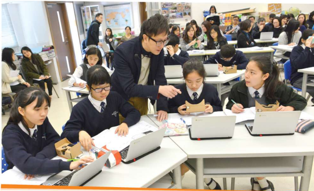
陳副校長指導同學使用虛擬實境描寫細節