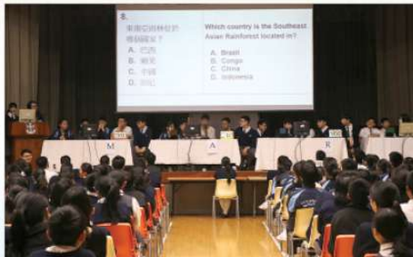
四社學術常識問答比賽