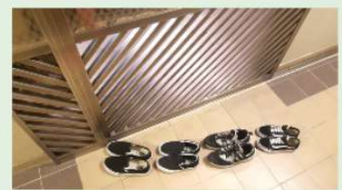
4A 黃湘怡作品 《孩(鞋)子》