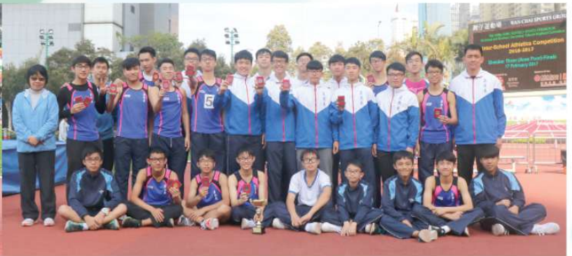
學界男子田徑隊大合照