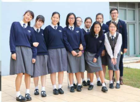
女子排球隊獲「中學校際排球比賽女子甲組團體亞軍」