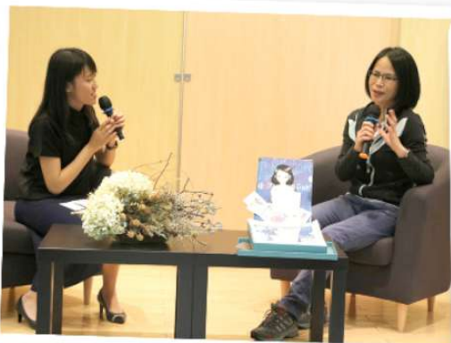
見面歡迎會以輕鬆對談形式進行，鍾教授每提起家中丈夫、家貓小肥都喜不自勝。