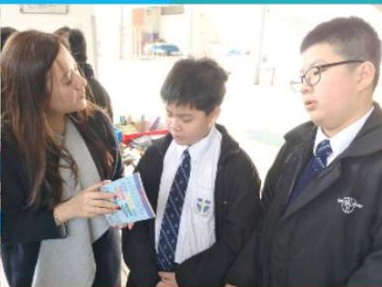
English teacher explaining to students