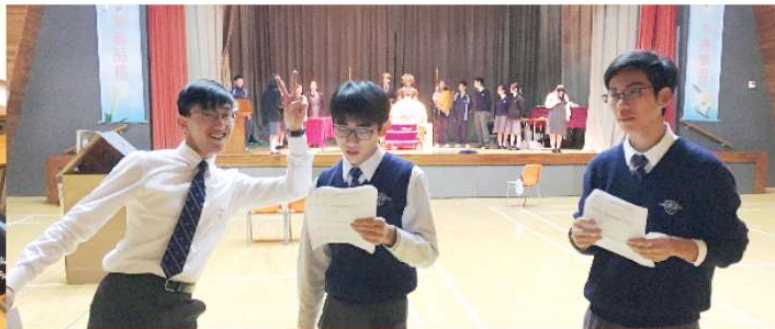
MCs full of enthusiasm and energy