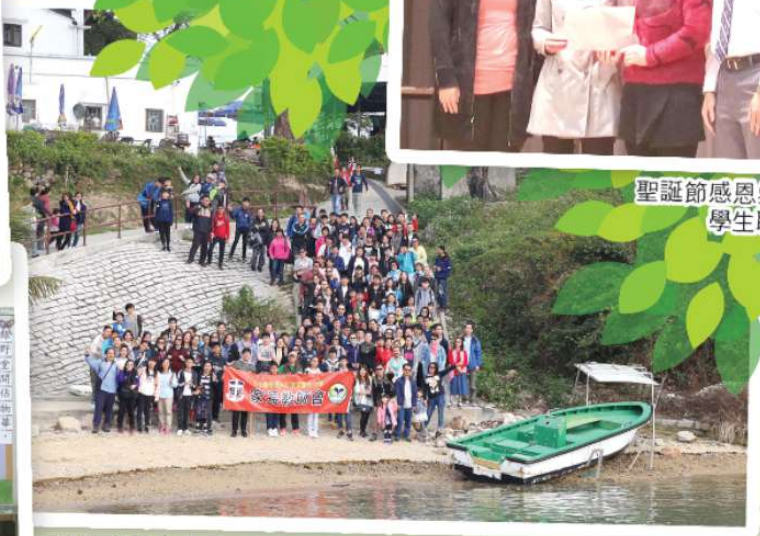
2017家教會旅行——「一家一齊遊一遊」