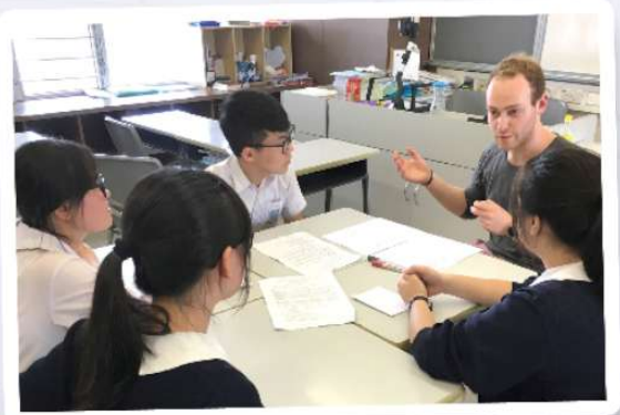
Having the chance to talk with our American guests in small groups means a lot to our students. They understand that not only local teenagers but also American teenagers have to strike a balance between personal interests and academic achievement in their daily lives.