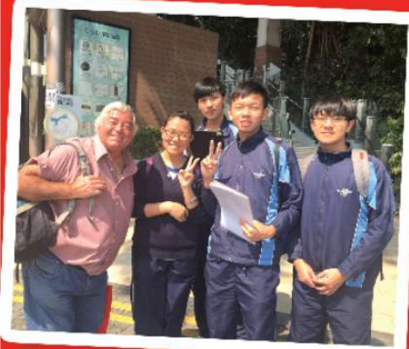
同學在赤柱大街訪問外籍遊客

中五級： Conducting a survey on tourists' shopping experience