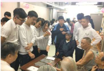
4Y同學為「老友記」表演魔術

感謝上帝的恩典成就了同學生命的美好成長，願同學都能將這次的經歷帶進生活，造福社群。