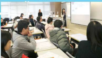
課程領導專業發展計劃 — 本校中文科向友校分享課程設計