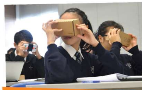
學生以Google Cardboard全方位觀察北角景物