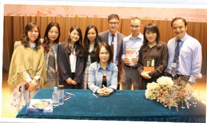
鍾教授與本校中文老師合照