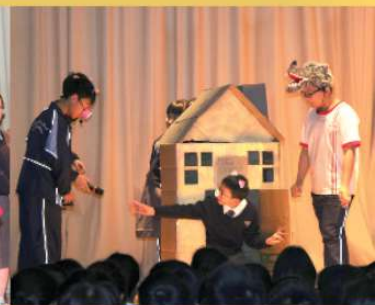
Junior form drama Three Little Pigs