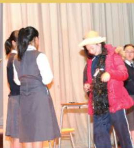
Junior form drama The Gift