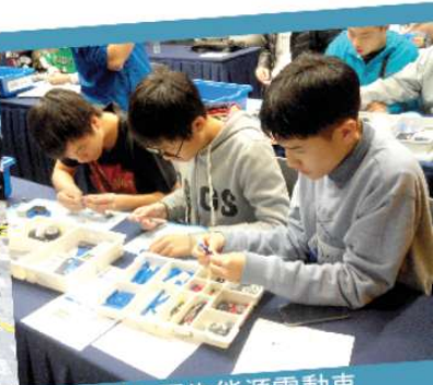
製作再生能源電動車