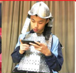
...because I have so much free time