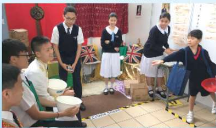
語文教育及研究常務委員會和 教育局合辦之「世界閱讀日」 本校英語攤位