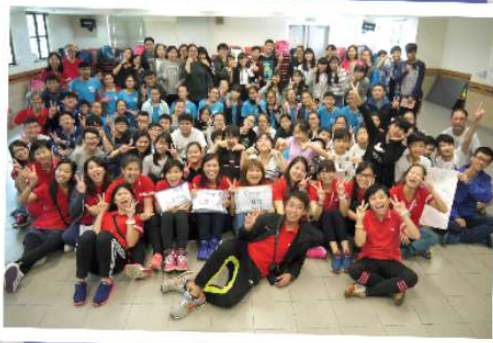
同學於「4C青年義工領袖計劃2016-17聯校培訓營」的大合照。