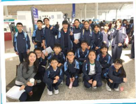
中一生勇毅地在香港國際機場訪問外籍遊客。完成後，同學臉上都掛著滿足的笑容。

中一級： Interviewing native English speakers