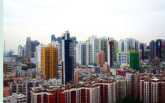
4R 馮建熹作品 《香港是我家》