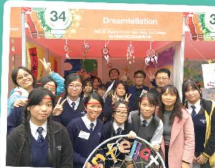
展銷會當天，錢校長到場打氣，還向同學買了很多「捕夢網」作支持