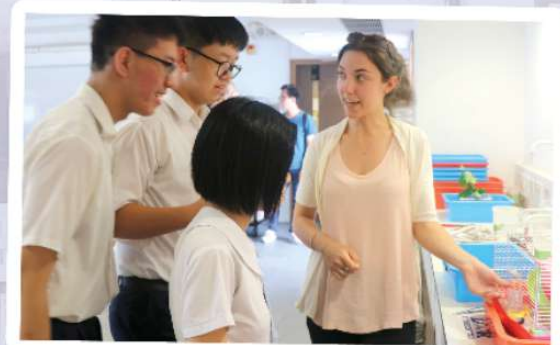
Our students showed our guests around in the campus and shared their school life.