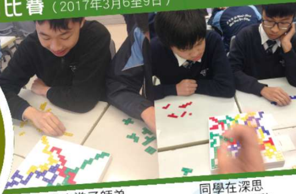
師兄走進了師弟設下的困局呢！