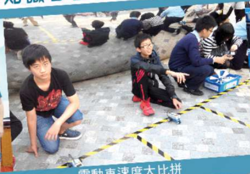
電動車速度大比拼