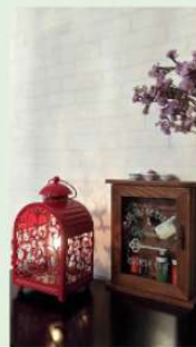
4A 李滢韜作品 《家的感覺》