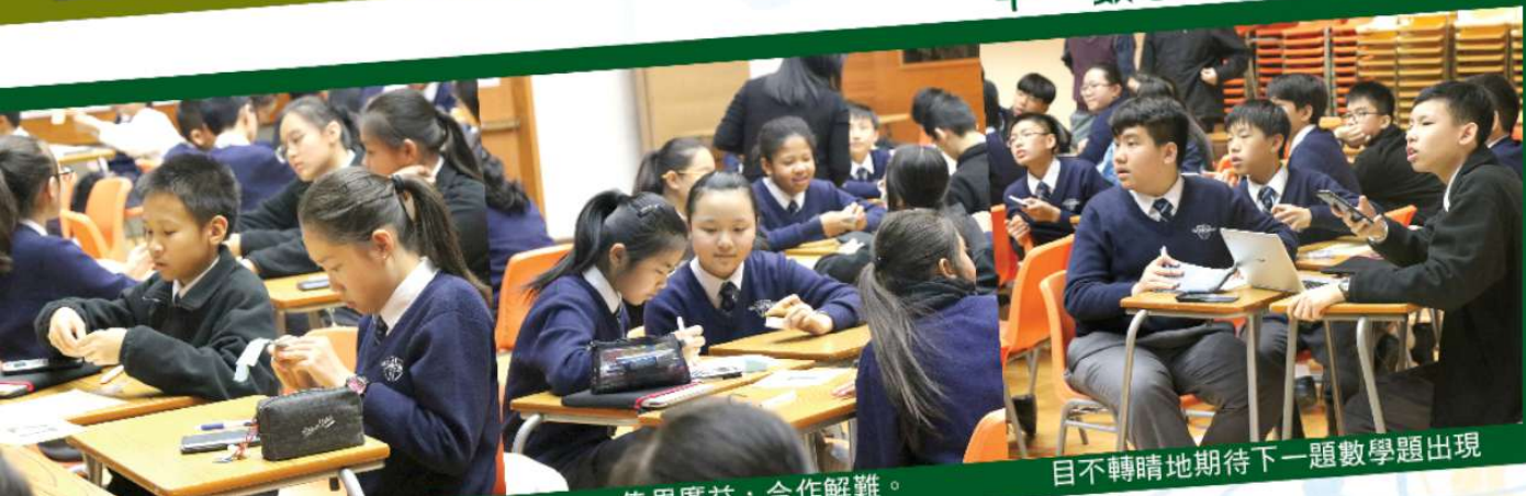
參加者專心地摺疊立體圖形