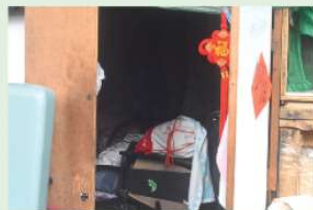
4M 張子濤作品 《家無處不在》