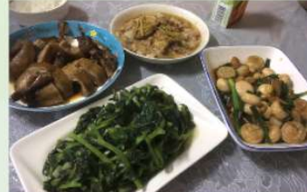
4Y 黃明麗作品 《媽媽的味道》