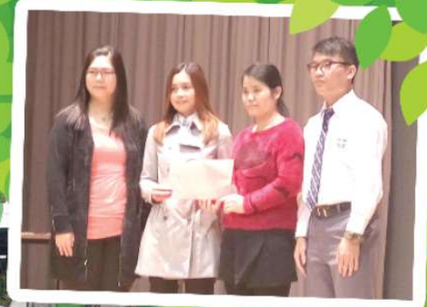
聖誕節感恩崇拜暨 學生聯歡會