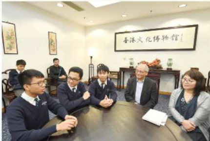
本校獲教育局邀請參觀「金庸館」 與教育局吳克儉局長對談