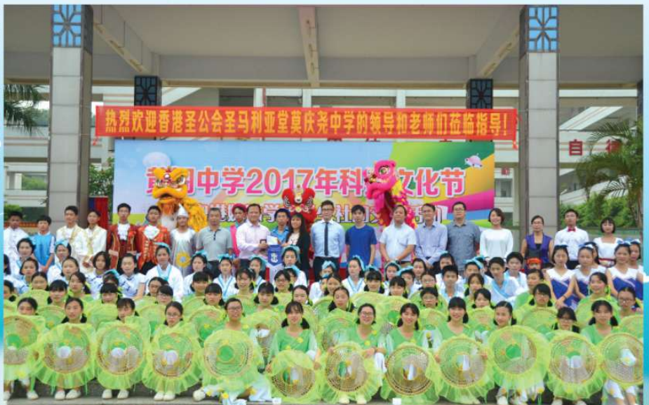
本校獲內地姊妹學校「南沙黃閣中學」邀請出席 「2017年科技文化節 暨 粵港姊妹學校學生社團交流活動」